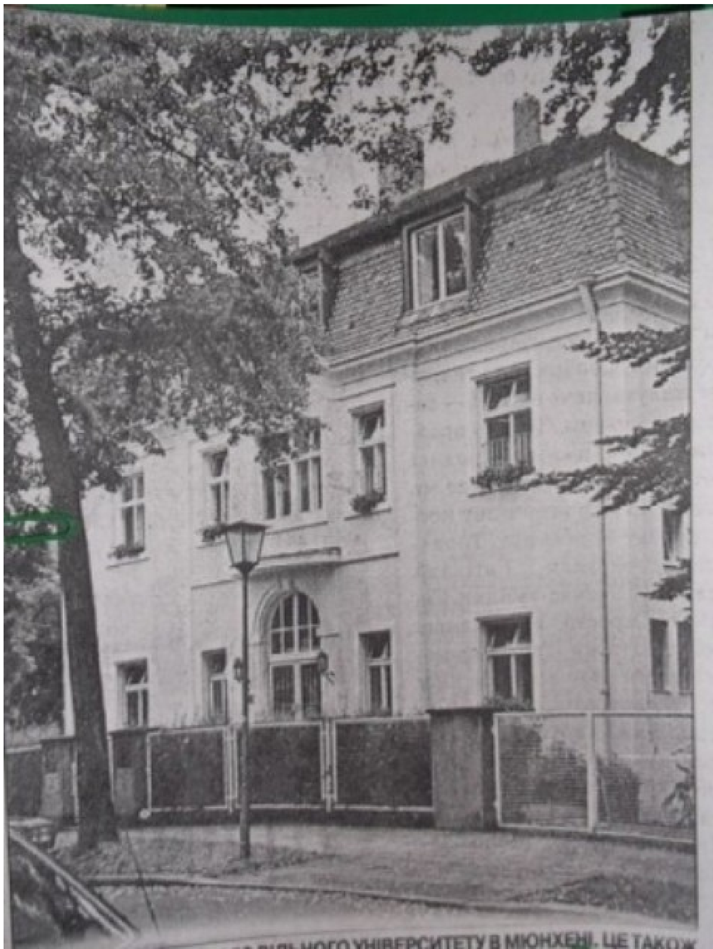
...НОГО УНИВЕРСИТЕТУ В МЮХЕНЕ. ЦЕ ТАКОЖ