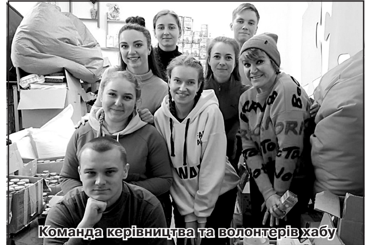
Команда керівництва та волонтерів хабу