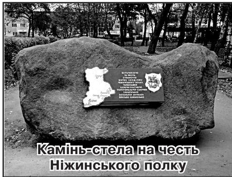
Камінь-стела на честь Ніжинського полку

У зв'язку з цим ніжинська «Просвіта» внесла пропозиції державної ваги, покликані забезпечити гідне вшанування 375-річчя відновлення української держави Військо Запорозьке та 375-річчя заснування Ніжинського полку Війська Запорозького: