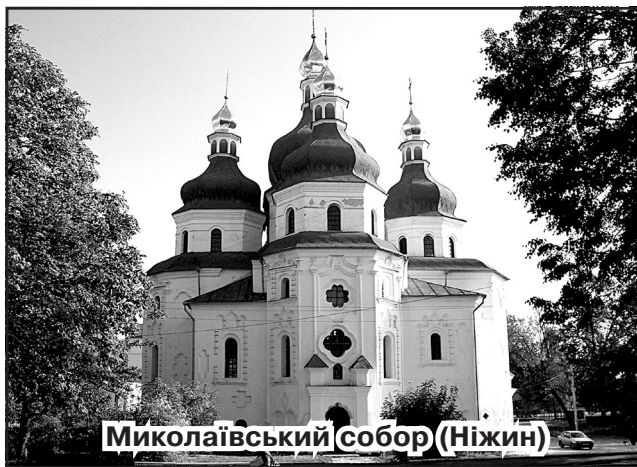
Миколаївський собор (Ніжин)

У світі все взаємопов'язано. Деякі сув'язі лежать на поверхні, а для спостереження інших потрібні великі фахові знання. Тим не менше, нам цікаво споглядати те, що пов'язує фрагменти наших знань і уявлень із загальною картиною світу. Тож запитаймо себе: чи пов'язаний з Італією Ніжин?