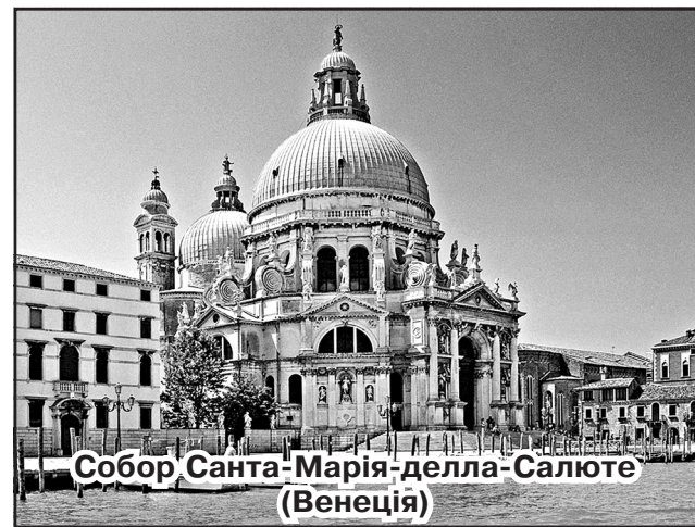
Собор Санта-Марія-делла-Салюте (Венеція)